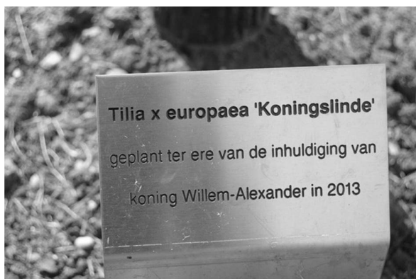
De kracht van Oranje in een krachtige boom: de Kroningsboom.

De redactie wenst hen veel succes met hun bedrijven!