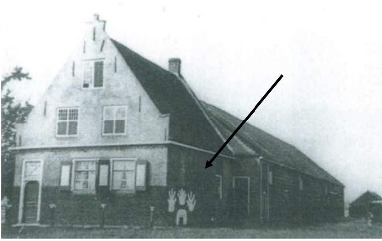
'De Drie Klauwen' omstreeks 1900. De klauwen rond het kelderraam zijn hier duidelijk te zien.

Toen à ze den volgenden dag buuten kwêeme, zagge ze dat 'r boven 't kelderrêem drie groote klauwen stienge dir à den duuvel z' n eigen vast 'ehouwen ôo. Lêeter è ze een schilder litte komme om mie witte verve die klauwen wig te kriegen, mè nêe een stuitje kwamme ze wee terug. De schilder is verscheie keren terug motte komme, mè 't ei nie 'e holpe, d' r bleve drie klauwen. Gin wonder dat d' oeve de nêem kreeg: " De drie klauwen " .