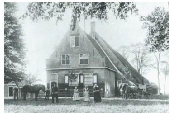
'De Drie Klauwen' omstreeks 1890.

Het feest was noe toch kepot en de gasten bin stilletjes of 'edrope. Toch vee verschrokke en eenmaal buuten toch ok nog vee benauwd. De fermielje ei dien êevend op d 'r knieën toch nog mè een rozen 'oedje éleze, mè d 'r wier nie mî an de blinden 'e rammeld.