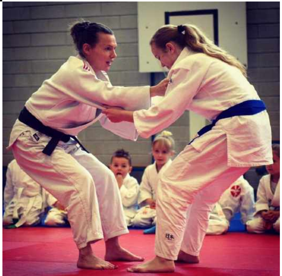
Bovenste foto is tijdens het lesgeven en de tweede is tijdens de maandelijkse puntenwedstrijd in de rol van scheidsrechter/begeleider.

Toen we in 's-Heerenhoek kwamen wonen kenden we helemaal niemand hier, maar toen ik bij de BSO hier op school ging werken, leerde ik al snel veel leuke mensen kennen en kwam steeds meer de vraag of ik hier ook judolessen wilde opstarten. Dus zo geschiedde, mijn vereniging, Judo Goes, had nu naast Goes, Middelburg, Vlissingen nu ook een dependance in de gymzaal in 's-Heerenhoek.